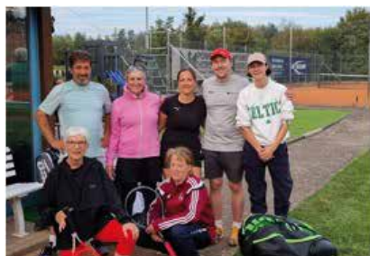
Saisonende beim TC Götzingen: Tennisspiele & Boccia- Wettkämpfe